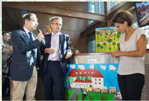
Madame Najat Vallaud-Belkacem avec le Recteur et le Directeur de la DAC, devant les œuvres réalisées par les enfants avant participé à l'action EMEGA- 2014